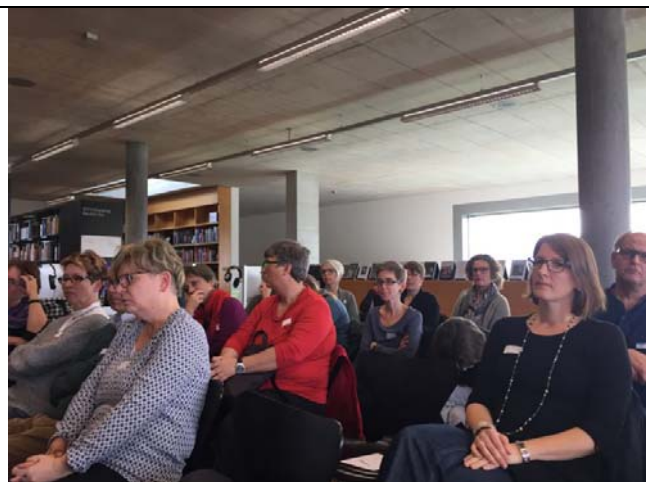
Über 30 ADM-Mitglieder setzen sich Winterthur mit dem neuen Leitbild auseinander