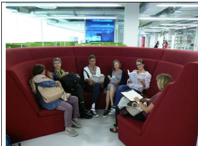
Imposante Sitzgelegenheit im KIM Konstanz